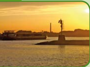
Uitzicht op de Waal bij zonsondergang