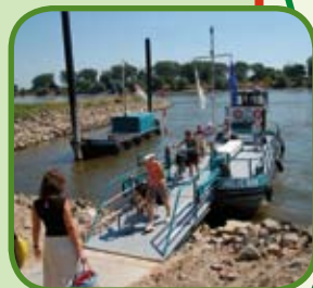
Veerdienst Millingerwaard - Doornenburg

Heeft u op- of aanmerkingen over de bewegwijzering, de route of de bijbehorende fietsroutekaart, dan kunt u contact opnemen met het routebureau van het Regionaal Bureau voor Toerisme KAN via www.lekkerfietsen.nl en T. 0900-6070803 (15 cpm).