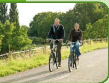
Fietsen op de dijk

De theetuin, gelegen midden in het prachtige natuurgebied De Millingerwaard is een romantische, stijlvolle mediterrane tuin met prachtige borders en zitjes. In de tuin bevinden zich meer dan duizend soorten planten. Geopend apr. t/m okt. di t/m zo 10.00 – 18.00 uur. Entree € 5,- inclusief consumptie.